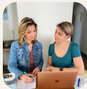
Coaching à l'institut