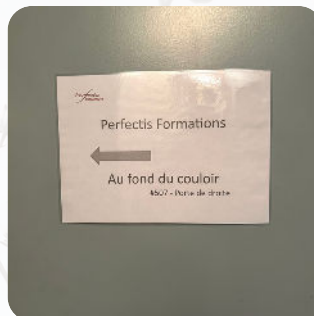
A la sortie de l'ascenseur