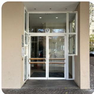
Entrée principale 17 place de l'europe – Lyon 6