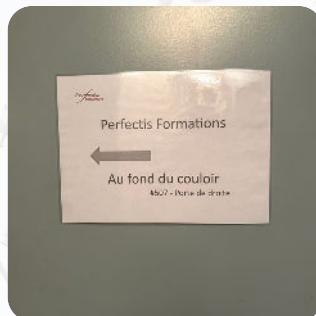
A la sortie de l'ascenseur